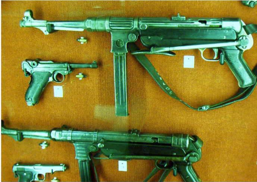
Een MP38, Schmeisser, 9mm, met links daaronder een Mauser 'Luger' P08

La Roche is de moeite waard om te bezoeken. Gelegen in een dal in de bocht van de rivier de Ourthe is het prachtig gesitueerd om van bovenaf te bekijken. In het centrum van het stadje is het zeer indrukwekkende 'Musée de la Bataille des Ardennes' gevestigd. Het is gelegen aan de Rue Châmont 5.