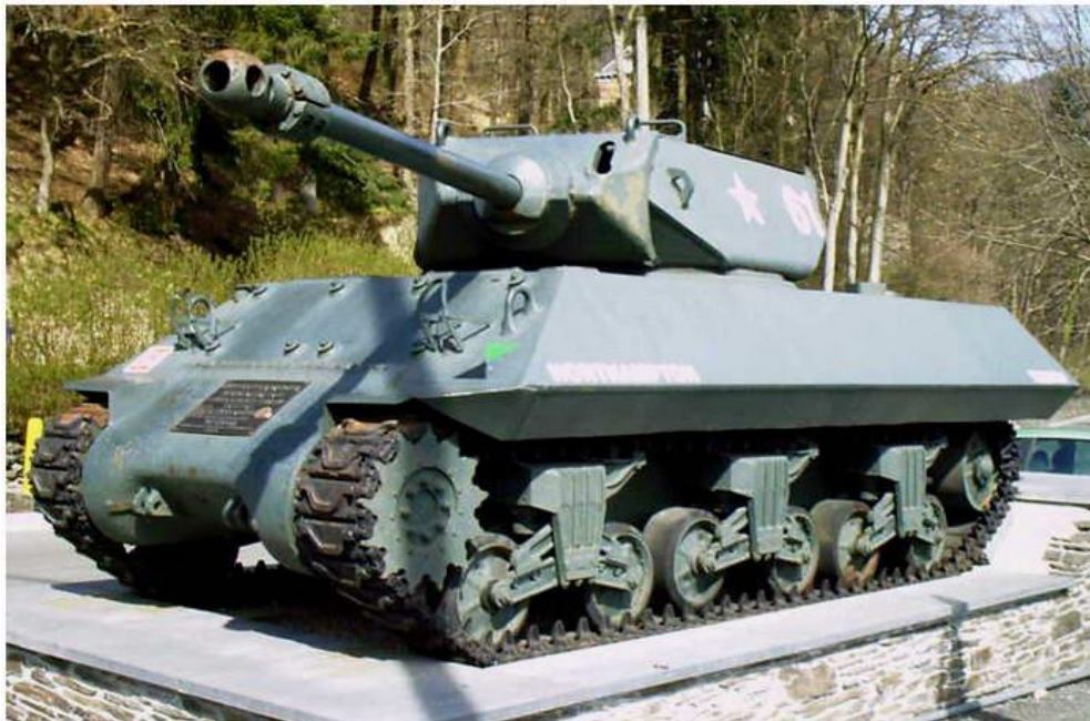
De Mk10 Tank Destroyer 'Achilles'

Verlaat het centrum en ga naar 'boven' (richting Hotton). Hiervandaan heeft u een heel mooi uitzicht op La Roche. Bij het kruispunt 'boven' staat een ' Achilles' Tank-Destroyer Mk10 '. Het voertuig was ooit eigendom van het 'Battle Museum' te Aywaille (nu gesloten). Het is liefdevol gerestaureerd door de eigenaar van het Musée de la Bataille des Ardennes.