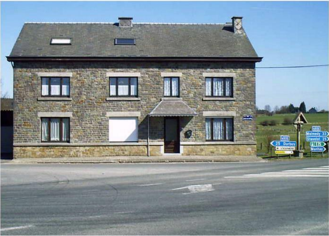
Kruispunt Grandmenil richting Manhay, Toen en Nu