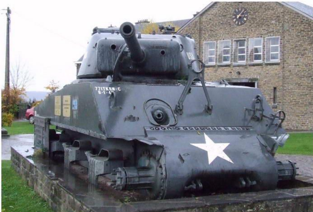
De Sherman van Beffe

Een M4A3 Sherman tank met 76mm kanon, maar zonder tracks, staat als monument in het dorp Beffe ter na gedachtenis aan Task Force Hogan. De tank stond tientallen jaren aan de weg tussen Samrée en Amonines langzaam te vergaan voordat het in het centrum van Beffe een permanente plek vond.