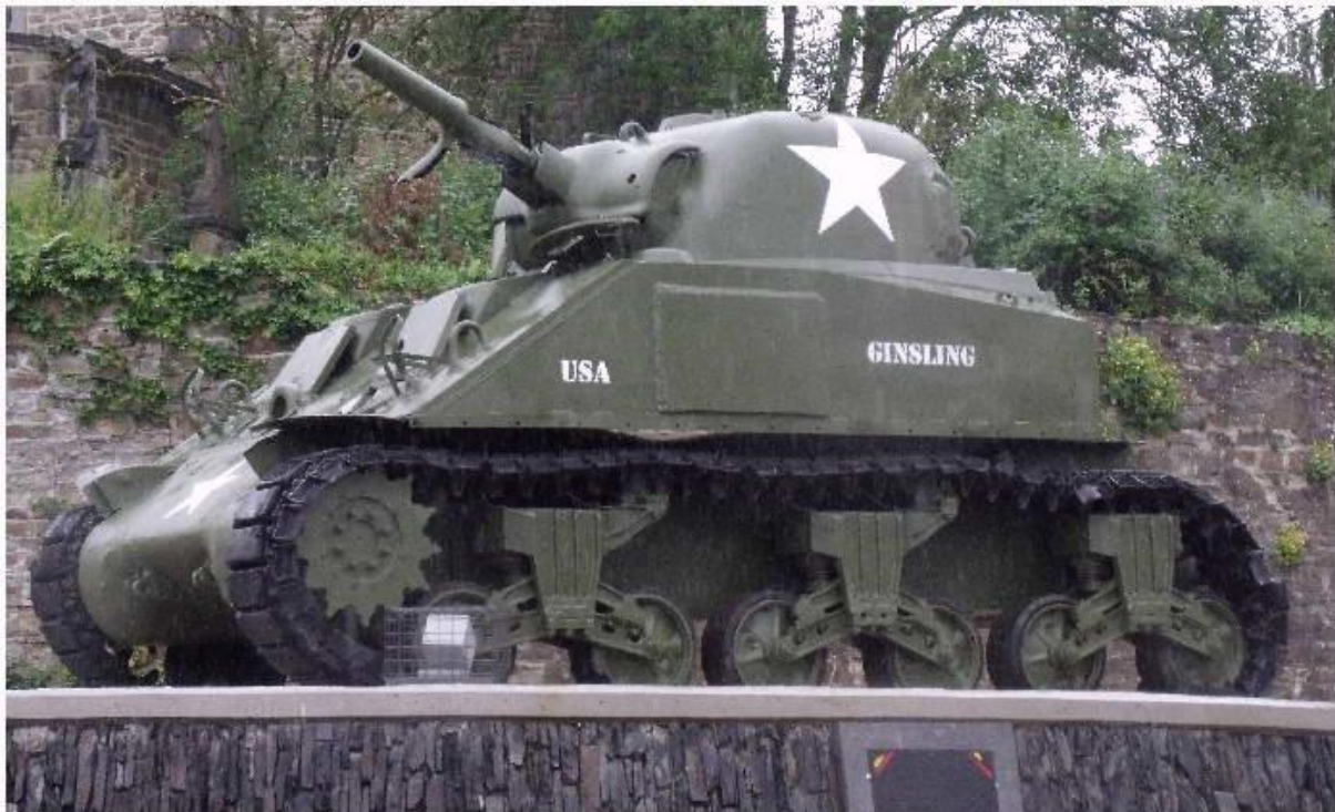
De Sherman geheel opgeknapt in 2010

Doordat de tank nu voor de helft ontmanteld is, is het mogelijk om een Sherman tank van binnen te bekijken en zich te verbazen over de dunne wand van de toren die weinig bescherming bood tegen Duitse granaten.