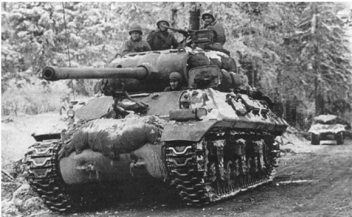
Een M36 Jackson, 3rd Armored Division nabij Malempré (3km ten zuiden van Manhay)

Ieder keer als het 3d Panzer Grenadier een aanval inzette om uit te breken ten zuiden en ten westen van Grandmenil werden ze genadeloos bestookt door de Amerikaanse jachtbommenwerpers en de artillerie. Ook gingen de gevechten op en neer rond het kruispunt van Manhay.