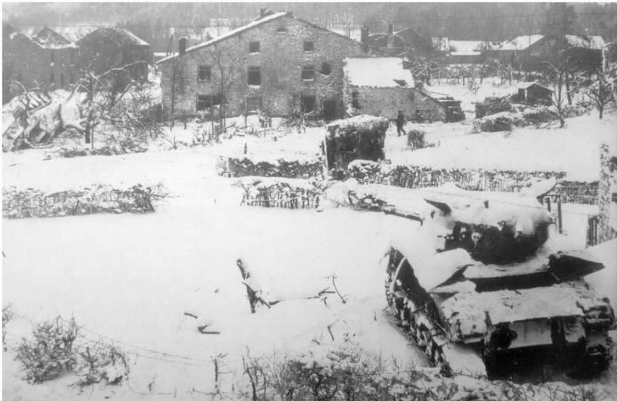
Manhay, rechts een uigeschakelde Sherman, links een Duitse Panther op haar zijkant

In snel tempo trokken de Amerikanen zich terug naar het noorden en viel Manhay in Duitse handen. Overal reden Amerikaanse tanks te zoeken naar een uitbraak naar het noorden. Overal doken Duitse troepen op die verschillende leidende tanks uitschakelden waardoor de wegen verstopt raakten. Commandanten van de terugtrekkende Amerikanen gaven opdracht de achterop komende tanks te verlaten en te voet naar vriendelijk linies te trekken.