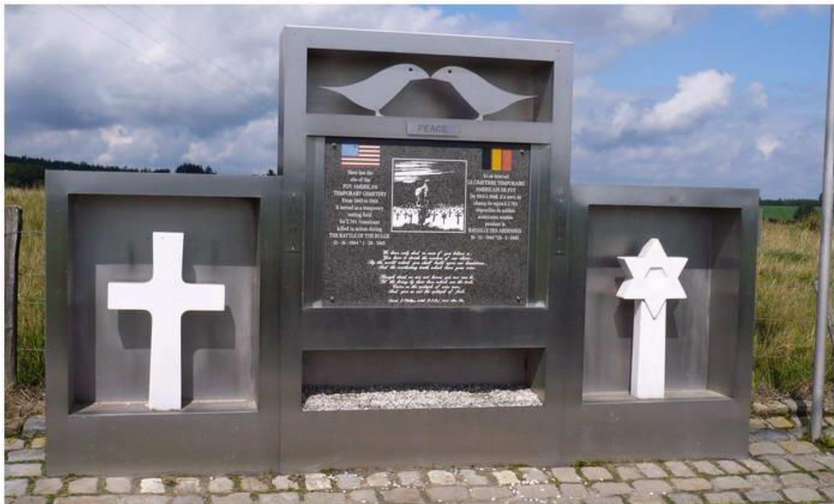
Iets voor de Duitse begraafplaats van Recogne (straatje rechts) staat een monument ter herinnering aan de tijdelijke begraafplaats voor 2701 Amerikaanse soldaten welke omgekomen zijn tijdens het Ardennen Offensief

Maar om 09.30 uur diezelfde morgen, met hulp van artillerie, wisten de 101st paratroopers Foy weer terug te pakken. Om 12.00 uur maakten de troepen zich gereed om door te stoten naar Noville. Het terrein was zwaar van de sneeuw en kou en de soldaten kwamen die dag niet verder dan Cobru. Een patrouille wist die nacht even in Noville te komen maar trok terug.