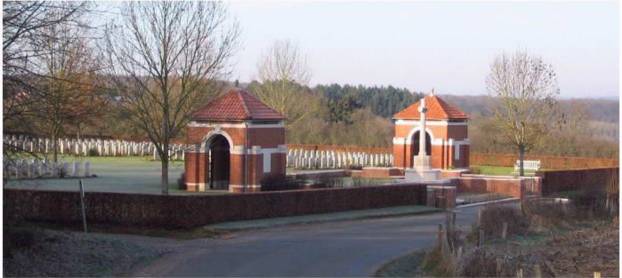
De Commonwealth begraafplaats nabij Hotton

We gaan nu verder naar Hotton dat ongeveer tien kilometer naar het westen ligt. Even buiten Hotton is een Gemeenebest (Commonwealth) begraafplaats. Hier liggen 666 onder Engelse vlag omgekomen manschappen begraven. Hiervan zijn er 21 niet geïdentificeerd. Niet alleen liggen hier manschappen die omgekomen zijn tijdens het Ardennen Offensief, ook soldaten die in de meidagen van 1940 zijn gevallen zijn werden hier na de oorlog herbegraven.