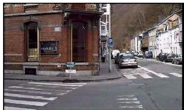
La Roche-en-Ardenne, ontmoeting tussen de Highlanders en de Amerikanen