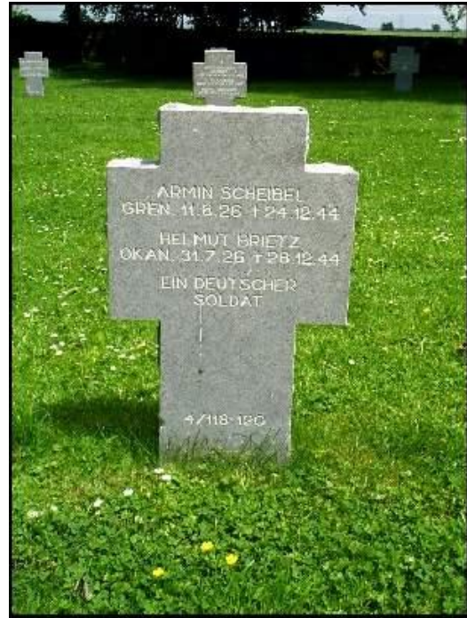
Recogne, de Duitse begraafplaats, met één van de vele stenen

Net als de Bastogne, heeft Noville het zwaar te verduren gehad tijdens het Ardennen Offensief. De eerste dagen van het offensief probeerden de Duitsers via deze route (Houffalize-Bastogne) een doorbraak te maken.