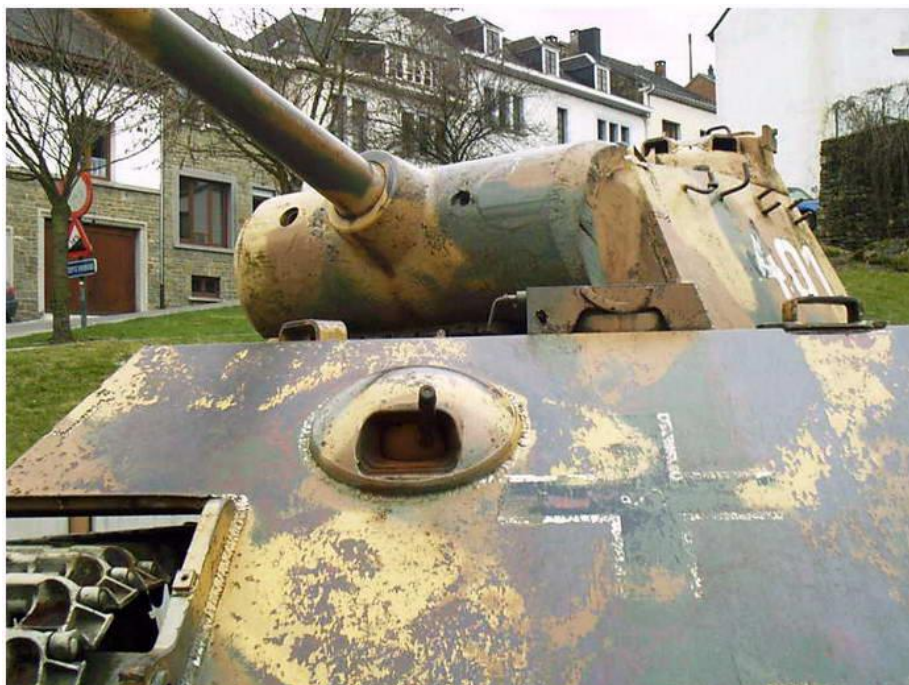
De Panther van Houffalize

Niet dat de uitgeputte Duitsers rust kregen. Vanaf 3 januari 1945 zetten de Amerikaanse divisies hun aanval in vanuit het zuiden en noorden om de 'punt eraf te knippen' naar Houffalize (zie begin van deze tour).