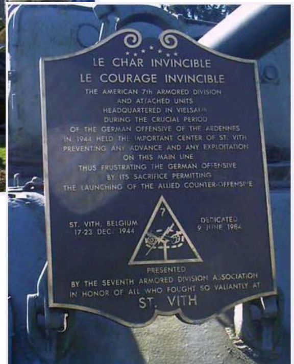
De Sherman van Vielsalm