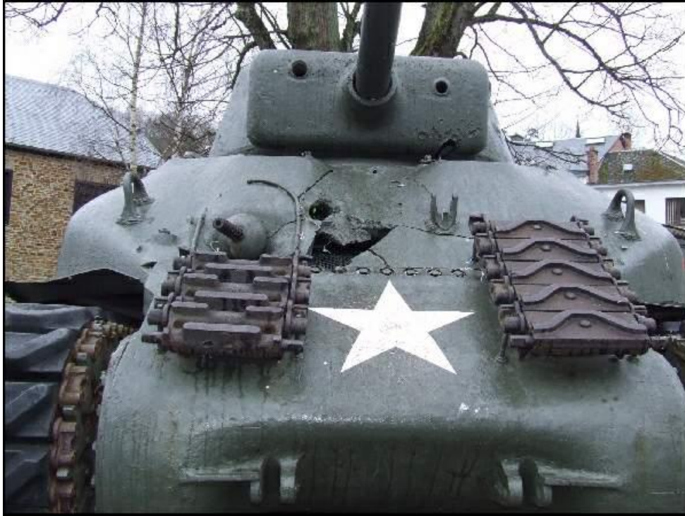
De M4A1 Sherman met 76mm kanon en de zware schade aan de voorzijde

Verlaat het centrum en ga naar 'boven' (richting Hotton). Hiervandaan heeft u een heel mooi uitzicht op La Roche. Bij het kruispunt 'boven' staat een ' Achilles' Tank-Destroyer Mk10 '. Het voertuig was ooit eigendom van het 'Battle Museum' te Aywaille (nu gesloten). Het is liefdevol gerestaureerd door de eigenaar van het Musée de la Bataille des Ardennes.