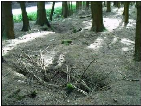
De bossen ten zuiden van Foy, met de schuttersputten

Ondanks een stroeve aanloop door een voorzichtige officier werd Foy vlot ingenomen. De Duitsers vochten hard terug maar moesten terug trekken naar Noville. De volgende ochtend plaatsten de Duitsers een tegenaanval en verdreven de paratroopers weer uit Foy, voor de zesde maal ging Foy over in andere handen.