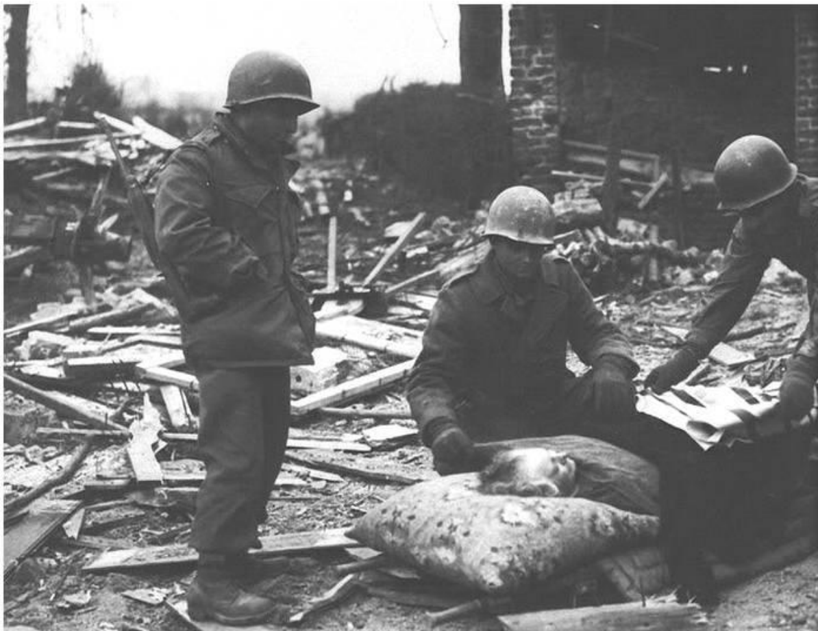
De enige inwoner (zij weigerde Manhay te verlaten) wordt verzorgd door mannen van de 517th PIR.

General Ridgeway stuurde een verse eenheid, de 3rd Battalion, 517th PIR van de 82nd naar Manhay. In de morgen van de 27ste december vielen deze om 04.00 uur Manhay binnen. Ten koste van 10 doden en 14 gewonden werden de Duitsers uit Manhay verjaagd.