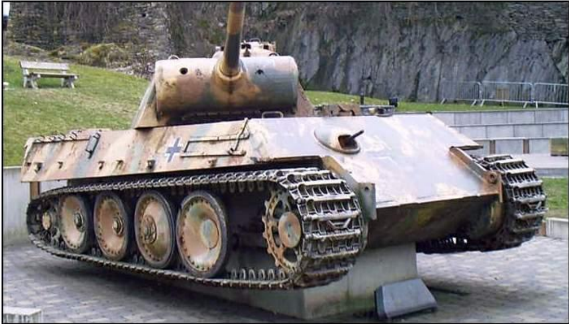
De Panther van Houffalize

Na Noville is het kleine 10 kilometer noordwaarts over de N30 naar Houffalize.