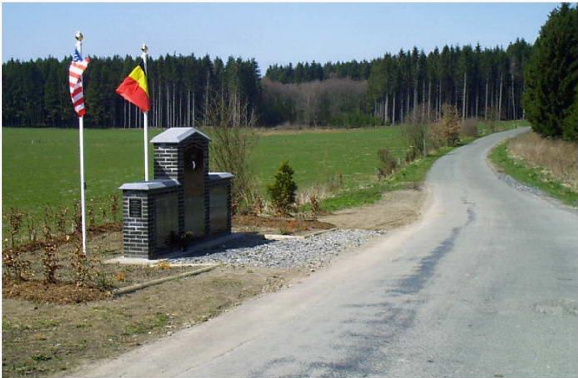
Het monument voor Easy Company van de 506th PIR. Op de achtergrond Le Bois Jacques met de schuttersputten.

Het monument is er mede gekomen door Tom Hanks, Home Box Office (de tv zender-producent) en de Jeep Corporation uit Detroit.